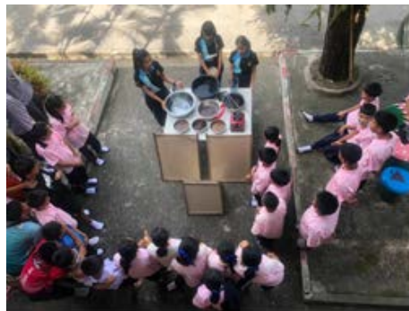
ภาพที่ 7 กิจกรรมการจัดกิจกรรมการเรียนรู้การทำกระดาษกกและผลิตภัณฑ์จากกระดาษกก

เกณฑ์การผ่านทั้งนี้ผู้เรียนจะต้องได้ผลคะแนนไม่น้อยกว่า 14 คะแนนหรือ ร้อยละ 70 ของคะแนนทั้งหมด ส่วนด้านทักษะ/สมรรถนะที่สำคัญของผู้เรียน (P) ผู้เรียนมากกว่าร้อยละ 80 ของผู้เรียนทั้งหมด ผ่านเกณฑ์การประเมินกระบวนการทำงาน กลุ่มตามหัวข้อ ดังนี้ 1. สามารถการร่วมกันวางแผนการทำงานเป็นลำดับขั้นตอน 2.การทำงานตามหน้าที่ที่ได้รับมอบหมายการ 3. แสดงข้อมูลหลักฐาน แหล่งสืบค้น แหล่งเรียนรู้ 4. การร่วมมือในการปรับปรุงผลงาน และ 5.ส่งงานตรงตามกำหนดเวลา เกณฑ์การผ่านผู้เรียนต้องได้คะแนน 14 คะแนน หรือร้อยละ 70 ของคะแนนทั้งหมด สุดท้ายด้านคุณลักษณะอันพึงประสงค์ ผู้เรียนร้อยละ 80 ผ่านเกณฑ์การประเมิน โดยหัวข้อการประเมินดังนี้ 1. มุ่งมั่นในการทำงาน 2. มีจิตสาธารณะ 3. รักความเป็นไทย ผู้เรียนได้คะแนนไม่น้อยกว่า 8 คะแนน หรือไม่น้อยกว่า ร้อยละ 70 ของคะแนนทั้งหมด สรุปการจัดกิจกรรมการเรียนรู้แผนที่ 1 เรื่องการทำกระดาษกก ผู้เรียนร้อยละ 80 ผ่านเกณฑ์การประเมินทั้งด้านความรู้ ด้านทักษะ/สมรรถนะที่สำคัญของผู้เรียน และด้านคุณลักษณะอันพึงประสงค์