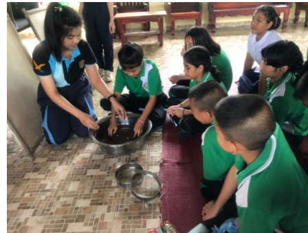
ภาพที่ 1 กิจกรรมการจัดกิจกรรมการเรียนรู้เรื่องกระดาศก