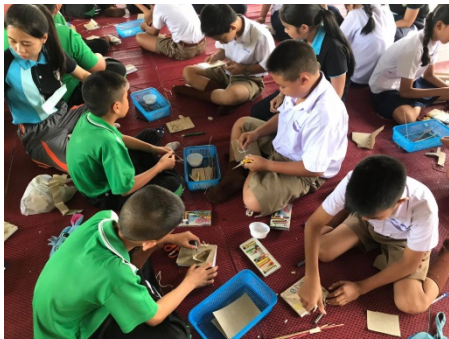
ภาพที่ 3 กิจกรรมการจัดกิจกรรมการเรียนรู้ผลิตภัณฑจากกระดาษกก