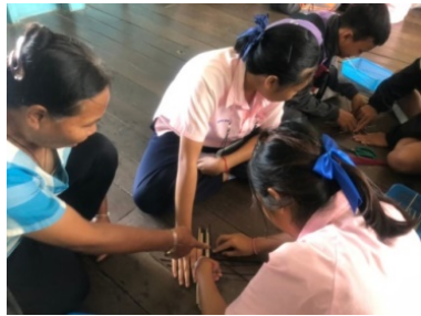
ภาพที่ 5 กิจกรรมการจัดกิจกรรมการเรียนรู้จากรองแก้วจากต้นกก

แหล่งสืบค้น แหล่งเรียนรู้ 4. การร่วมมือในการปรับปรุงผลงาน และ 5. ผลงานตรงตามกำหนดเวลา เกณฑ์การผ่านผู้เรียนต้องได้คะแนน 14 คะแนน หรือร้อยละ 70 ของคะแนนทั้งหมด สุดท้ายด้านคุณลักษณะอันพึงประสงค์ ผู้เรียนร้อยละ 80 ผ่านเกณฑ์การประเมิน โดยหัวข้อการประเมินดังนี้ 1. มุ่งมั่นในการทำงาน 2. มีจิตสาธารณะ 3. รักความเป็นไทย ผู้เรียนได้คะแนนไม่น้อยกว่า 8 คะแนน หรือไม่น้อยกว่า ร้อยละ 70 ของคะแนนทั้งหมด สรุปการจัดกิจกรรมการเรียนรู้แผนที่ 1 เรื่องการทำกระดาษขก ผู้เรียนร้อยละ 80 ผ่านเกณฑ์การประเมินทั้งด้านความรู้ ด้านทักษะ/สมรรถนะที่สำคัญของผู้เรียน และด้านคุณลักษณะอันพึงประสงค์