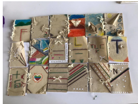
ภาพที่ 4 ผลิตภัณฑสมุดทำมือจากกระดาษกก