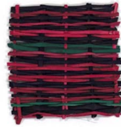
ภาพที่ 6 ตัวอย่างจากรองแก้ว